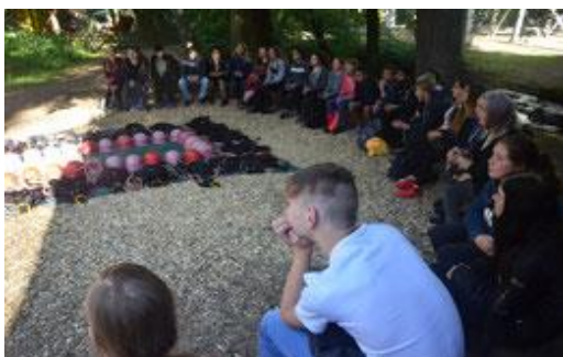
Team des Schülercafés

Es wird von den Teilnehmern dieser Profilgruppe erwartet, dass sie sich aktiv in die Gestaltung des Cafébetriebes mit einbringen und beispielsweise eigene Ideen hinsichtlich der Produktpalette oder Werbung entwickeln. Wir erwarten Zuverlässigkeit, Verantwortungsbewusstsein und freuen uns auf deine engagierte Mitarbeit.